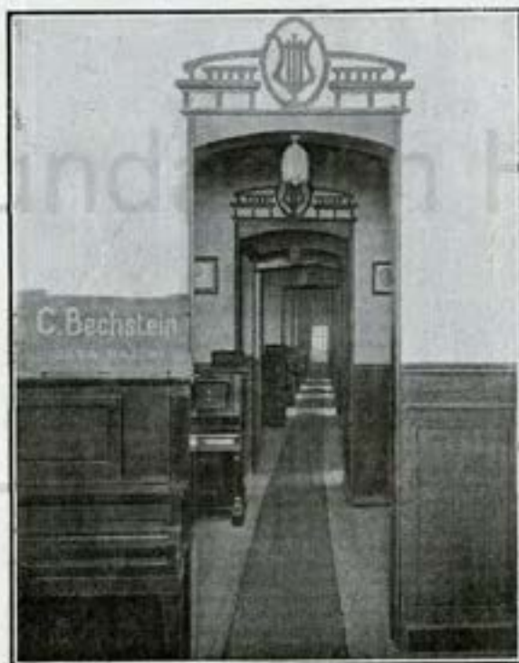
Galería de saloncitos donde están clasificados los instrumentos por marcas.

pensas en las Exposiciones nacionales. Pero tanto como la perfección de los procesos fabriles, perseverantemente sostenida por los sucesores del fundador a través de largos años de esfuerzos y trabajos, contribuyeron a consolidar la fama de la CASA HAZEN, sus bien entendidas iniciativas comerciales, adaptando, en beneficio de la clientela,