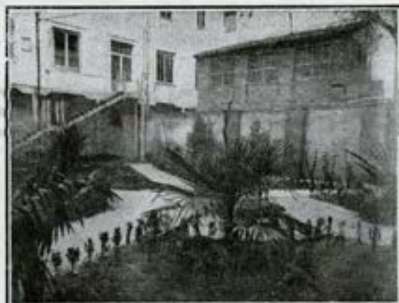
Vista exterior de los talleres de reparación de pianos.

Y bueno será, al abordar este punto, desvanecer algunas injustas prevenciones contra los pianos automáticos. No son éstos, en verdad, cual afirman sus detractores, fría expresión de la realidad musical, simples reproductores de lo que el genio de los artistas consiguió en el pentágono. Si eso pudo ser en tiempos ya lejanos, hoy no ocurre lo propio. La maravillosa perfección de la industria ha llevado a esos mecanismos algo que no