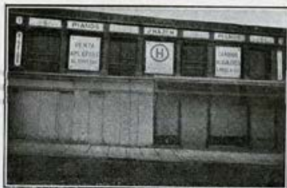
Portada de la Sucursal que tiene la Casa Hazen establecida en la calle de San Bernardo, núm. 1.

curar, aun en circunstancias excepcionalmente difíciles, que figurasen invariablemente en nuestros salones, tan frecuentados por los profesionales y amateurs , los modelos más finos y más apetecidos, tanto en el ramo de pianos de estudio, de arte y de concierto y de armoniums, como en el de instrumentos automáticos, hoy tan generalizados. Así obtuvimos la representación para España de las mejores marcas de pianos de Francia, Inglaterra, Alemania y Estados Unidos de América, así como de las nacionales.