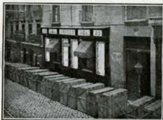
La Casa Hazen, Fuencarral, 55, al recibo de una expedición de pianos.

quiere productos inmejorables y en condiciones de economía sin competencia posible.