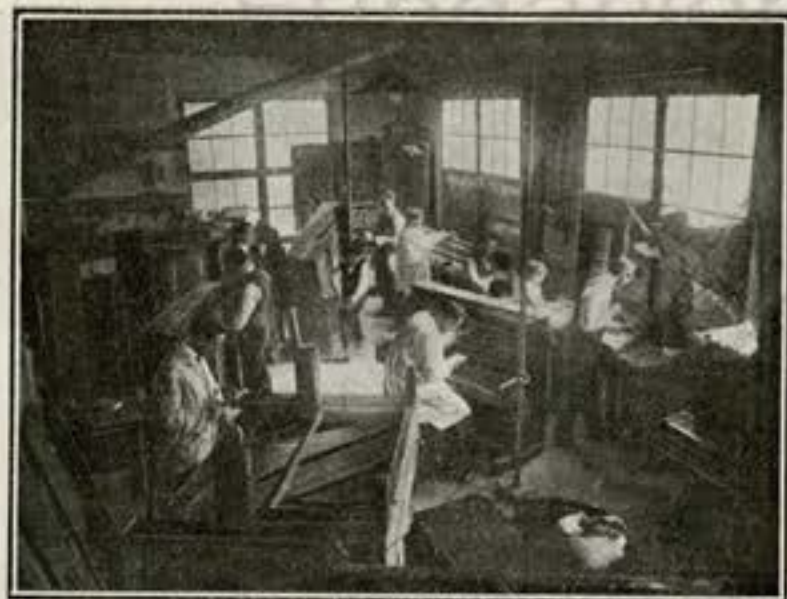
Vista interior del primer piso de los talleres de pianos.

interpretaron los artistas más famosos; autopianos eléctricos y a pedal , en combinación con algún otro instrumento.