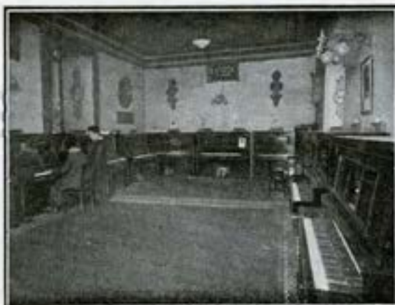
Vista parcial del salón de exposición de autopianistas.

bien por la cuantía de los precios facturados. Por el contrario, guarda en sus archivos millares de testimonios firmados por entidades particulares y oficiales, expresivamente laudatorios de nuestras eficacias mercantiles y de nuestra probidad industrial, del celo constante con que hubimos de defender sin desfallecimiento los intereses del público y los del Arte, anteponiéndolos a los nuestros. Sin titubear ante las dificultades de todo género que creó a la industria de instrumentos la guerra universal, hubimos de afrontar valerosamente el problema, logrando no disminuir, sino en cantidad casi inapreciable, nuestras importaciones, y sostener al mismo tiempo la modicidad en los precios. Hoy, terminada afortunadamente la gran catástrofe universal, habre-