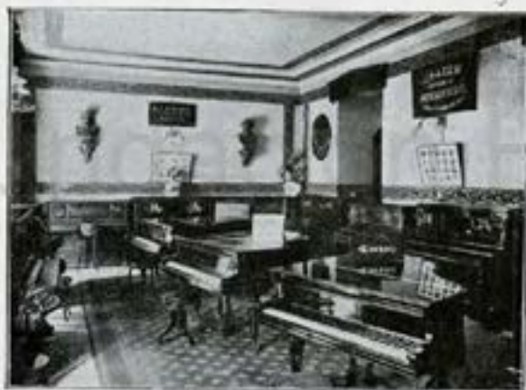
Salón-exposición de pianos de cola y verticales.

mos de recomenzar con mayor brío nuestras tareas comerciales, reanudando los viajes que acostumbramos a hacer por el extranjero, a fin de conocer cuantas mejoras se introducen en la fabricación de pianos, pianos automáticos y rollos de música para los mismos, y de hallarnos perfectamente al día, de los progresos de estas industrias artísticas.