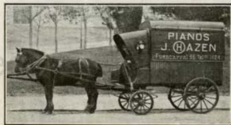
Coche especial para el transporte de pianos.

poner a disposición de los aficionados, con el surtido más completo de ese producto, lo mejor y más artísticamente elaborado, sobre la base de una extraordinaria moderación de precio. En la actualidad tenemos relaciones con fábricas que