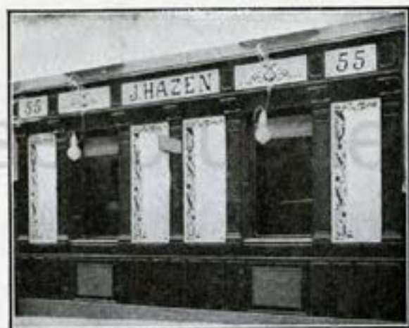
CASA CENTRAL, FUENCARRAL, 55