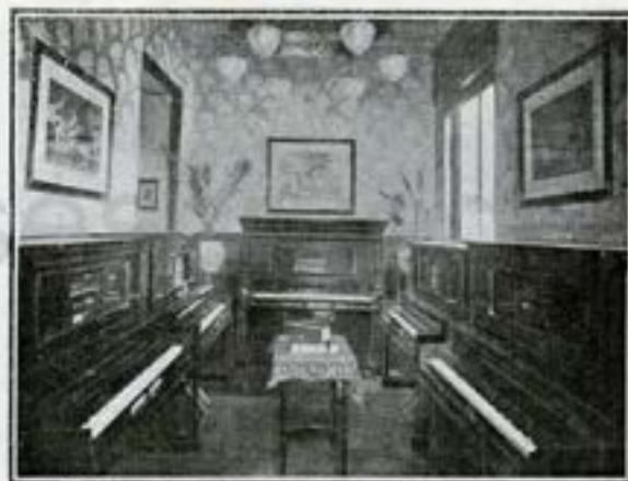
Vista de uno de los saloncitos de la galería.

pensas en las Exposiciones nacionales. Pero tanto como la perfección de los procesos fabriles, perseverantemente sostenida por los sucesores del fundador a través de largos años de esfuerzos y trabajos, contribuyeron a consolidar la fama de la CASA HAZEN, sus bien entendidas iniciativas comerciales, adaptando, en beneficio de la clientela,