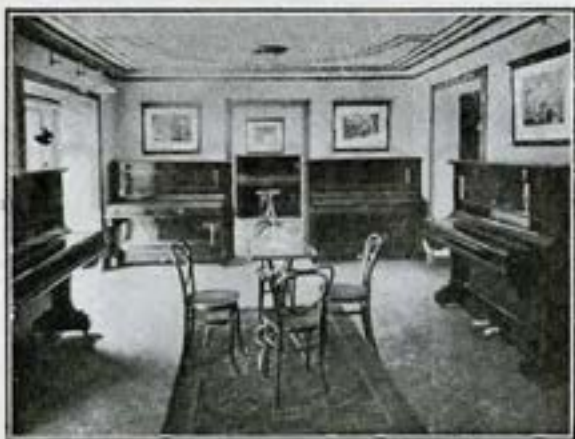
Vista interior del salón principal de la Sucursal.

efecto, no sólo un recreo agradable y sentimental, sino una completa educación artística a aquellos amantes de la música que, por impedírselo sus ocupaciones, por causa física, por el medio en que residieron durante los años más propicios al estudio, etc., no pudieron consagrarse al difícil y largo aprendizaje del piano.