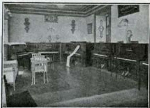
Sala de audiciones y pruebas de autopianistas.

circunstancias económicas por que atravesase el mercado mundial de pianos, importar a todo coste y sin interrupción los instrumentos procedentes de las marcas más modernas, extranjeras y nacionales, ofreciendo al público, a precios moderados, modelos insuperables en belleza y sonoridad, perfección de mecanismo y elegancia de formas.