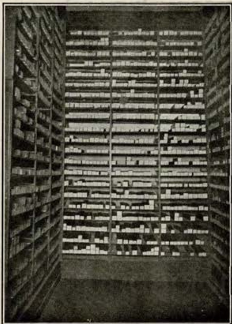
Stok de rollos de 88 notas.

nos suministran rollos de música esencialmente española, sin descuidar, por ello, el repertorio de obras clásicas, óperas y cuanto de más saliente se publica en el extranjero.