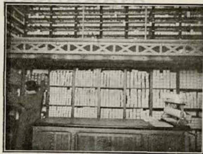
Biblioteca de rollos de música de 65 y 88 notas.

la CASA HAZEN y que justifican de un modo pleno su buena fama secular, las que nos permiten honrar nuestra lista de clientes con centenares de nombres conocidos en el mundo del arte y en el de la alta sociedad española; las que nos convirtieron en proveedores predilectos de innumerables entidades particulares, de Centros docentes, Comunidades religiosas, Circulos y Clubs, Teatros, Cafés y otros lugares de espectáculo y esparcimiento; las que hemos conservado a través de una existencia de 104 años y que han situado este Establecimiento a la cabeza de sus similares españoles, y las que nos permiten mirar con plena confianza el porvenir.